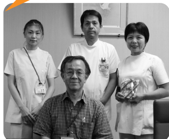
学長へ優勝を報告

ただ少し気がかりなのは、今年で33回を迎えたこの大会が「来年以降開催されるかどうか分からない」ということです。ぜひ今後もこの様に職種を越えて交流ができる機会を持てることを期待しています。ここまで医大合同チームを支えて下さったみなさまに感謝いたします。