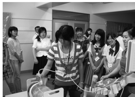
シミュレーション機器で胎児超音波を体験