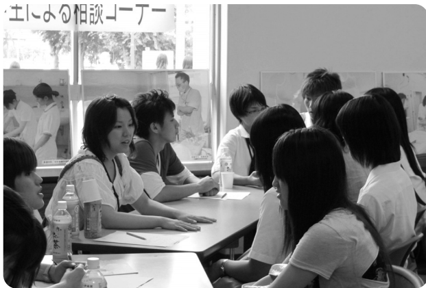
真剣な質問が次々と～在学生による相談コーナー～

今回の成功は、学生ボランティアなど数多くの皆さんの協力のおかげです。ここに厚くお礼申し上げますとともに、今後ともご協力 をお願いいたします。