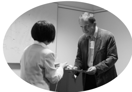
記念品とメッセージ授与のセレモニー