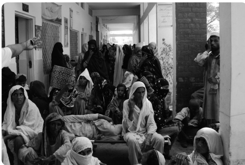
整理券もらった後、診察を待つ人々

JDRでは現地でテントをはり野営することもあります。今回は安全面を考慮し警察官が多数護衛しているムルトンのホテルに宿泊し、毎朝6時に出発して、片道2時間弱をかけてサナワンという田舎町にあるRural Health Centerまで軍と警察の護衛のもと移動し、臨時医療施設を設置して診療にあたりました。