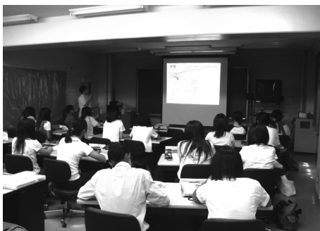
熱心に耳を傾ける受講生たち

受講生たちは、若い女性がかかりやすい子宮の病気の原因とその予防などについての講義や胎児超音波をシミュレーション機器を用 いて体験できる実習などを通して、子宮の大切さや生命の尊さを学びました。